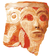
ИАЭТ СО РАН