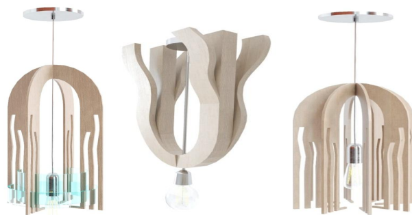
Рисунок 2 – Подвесные светильники