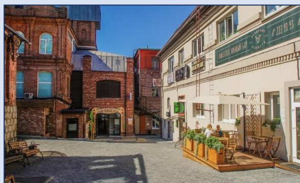
6. Старый дворик ГУМа