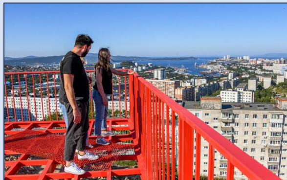
2. Смотровая площадка на сопке Бурачка