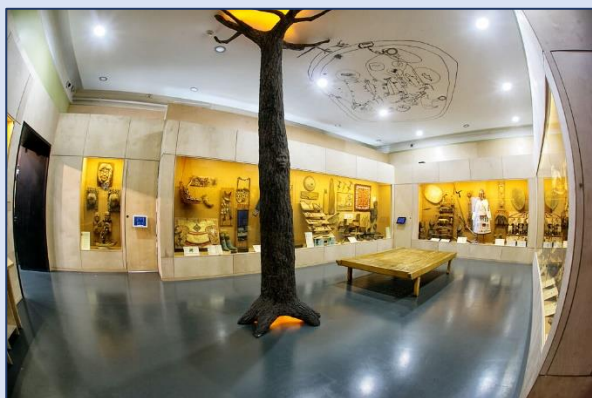
13. Музей истории Дальнего Востока имени В. К. Арсеньева (Светланская улица, 20)