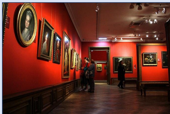
14. Приморская государственная картинная галерея (Алеутская улица, 12)