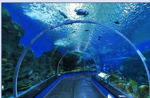
11 Приморский океанариум (улица Академика Касьянова, 25)