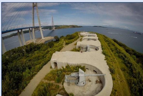
15. Новосильцевская батарея (посёлок Поспелово, 13)