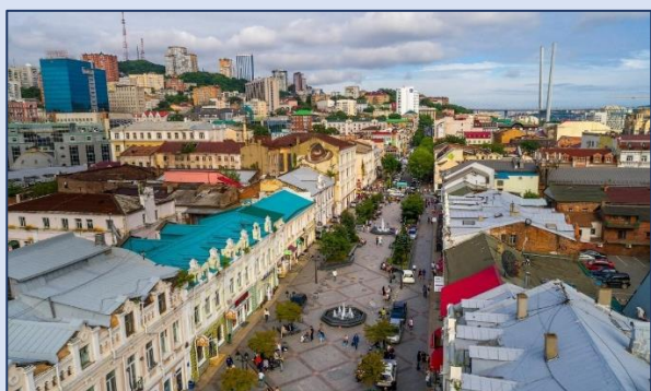
5. Владивостокский Арбат