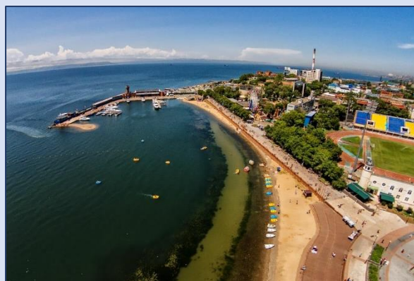
4. Набережная Спортивной гавани