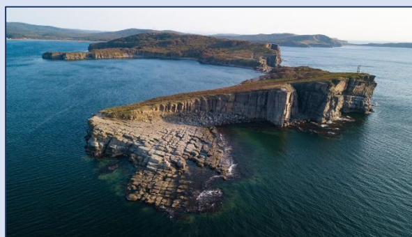
10. Мыс Тобизина (о-в Русский)