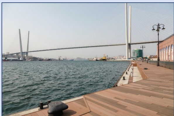
3. Набережная Цесаревича