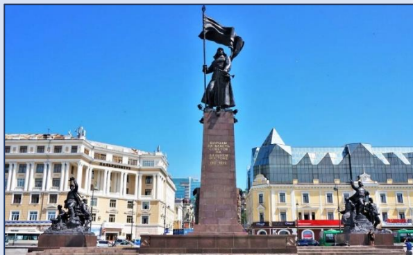
1. Площадь Борцов за власть Советов