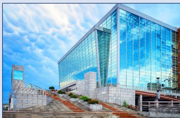
12. Приморская сцена Мариинского театра (Фастовская улица, 20)