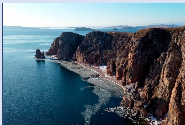
8. Остров Шкота