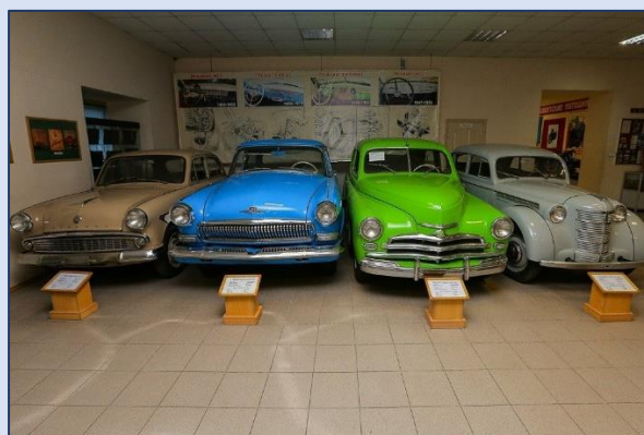
16. Музей автотостарины (Сахалинская улица, 2а)