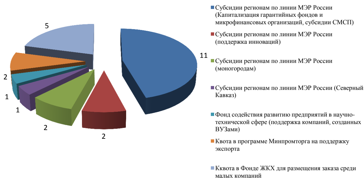
Рис. 3. Финансирование программ поддержки СМСП в регионах РФ в 2010 году

В 2010 году из федерального бюджета субъектам РФ на реализацию программ поддержки СМСП было предусмотрено 26 млрд рублей (см. Рисунок 3).