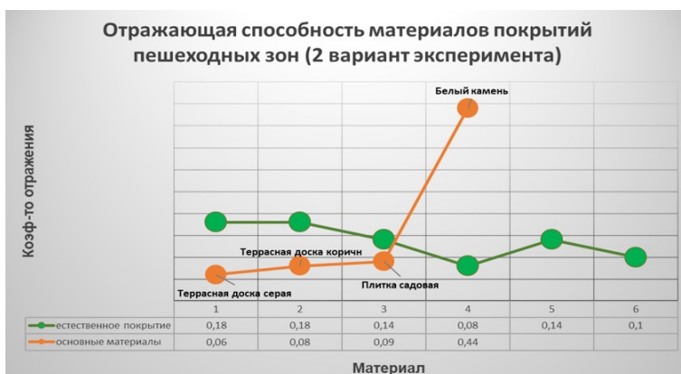
Рис. : Зависимость коэффициента отражения тестируемых материалов (2 вариант эксперимента) покрытия пешеходных зон