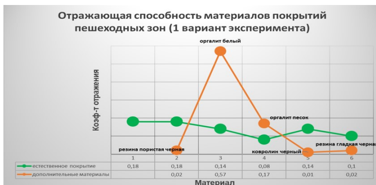
Рис. : Зависимость коэффициента отражения тестируемых материалов (1 вариант эксперимента) покрытия пешеходных зон