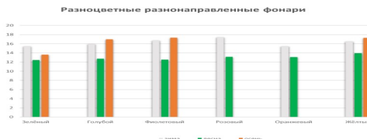
Рис. : Освещенность территории ООЗТ «Воробьёвы горы» с помощью ландшафтного освещения в разные сезоны 2025 года