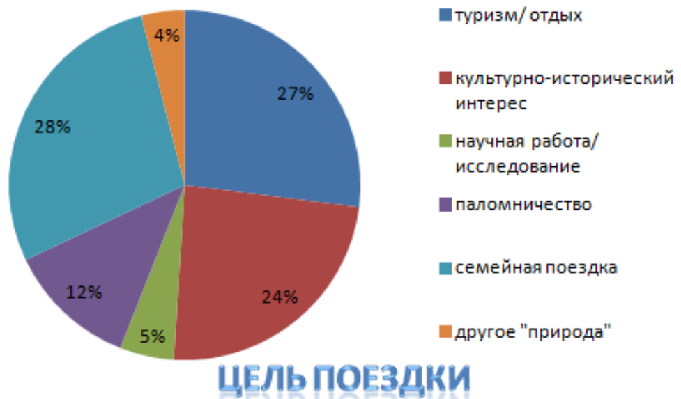
Рис. : 4. Данные по цели поездки