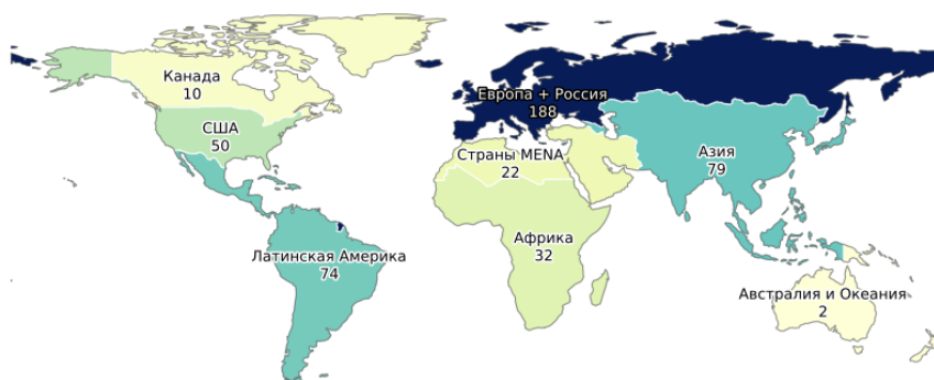
Рис. : 3. География политических деловых циклов (2000–2025)