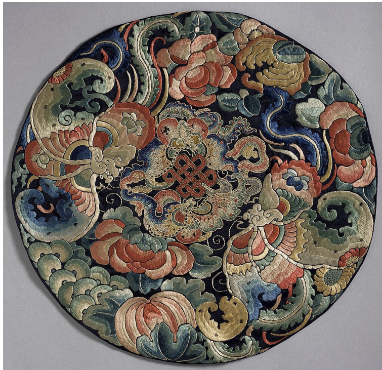
Рис. : Китайская вышивка конца династии Цин, 1850–1900. В центре композиции — буддийский «бесконечный узел»: 12 звеньев (āyatana) взаимозависимого происхождения; а также символ мудрости и гармонии.