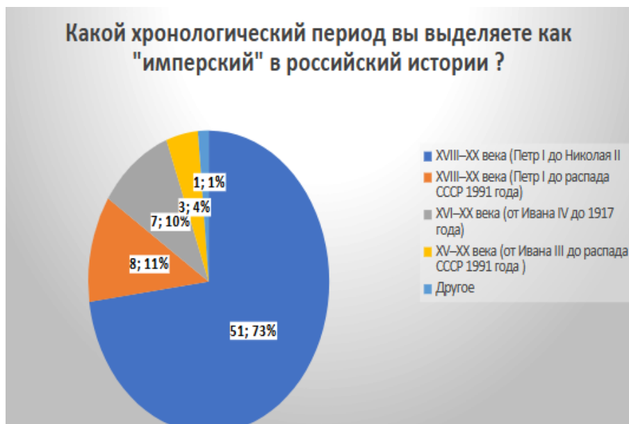
Рис. : 4 Ответы на вопрос: "Какой хронологический период вы выделяете как "имперский" в российской истории ?"