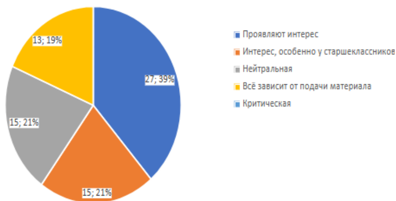
Рис. : 1 Ответы на вопрос: "Как учащиеся реагируют на темы, связанные с Российской империей?"