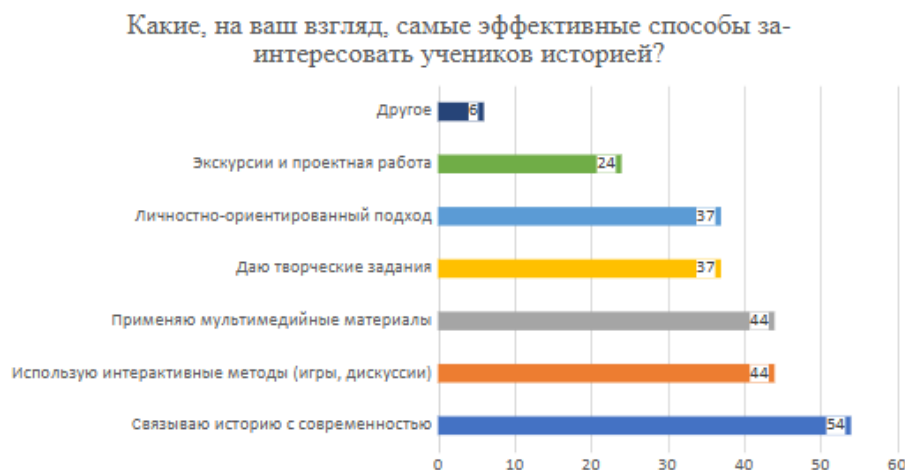
Рис. : 5 Ответы на вопрос: "Какие, на ваш взгляд, самые эффективные способы заинтересовать учеников историей?"