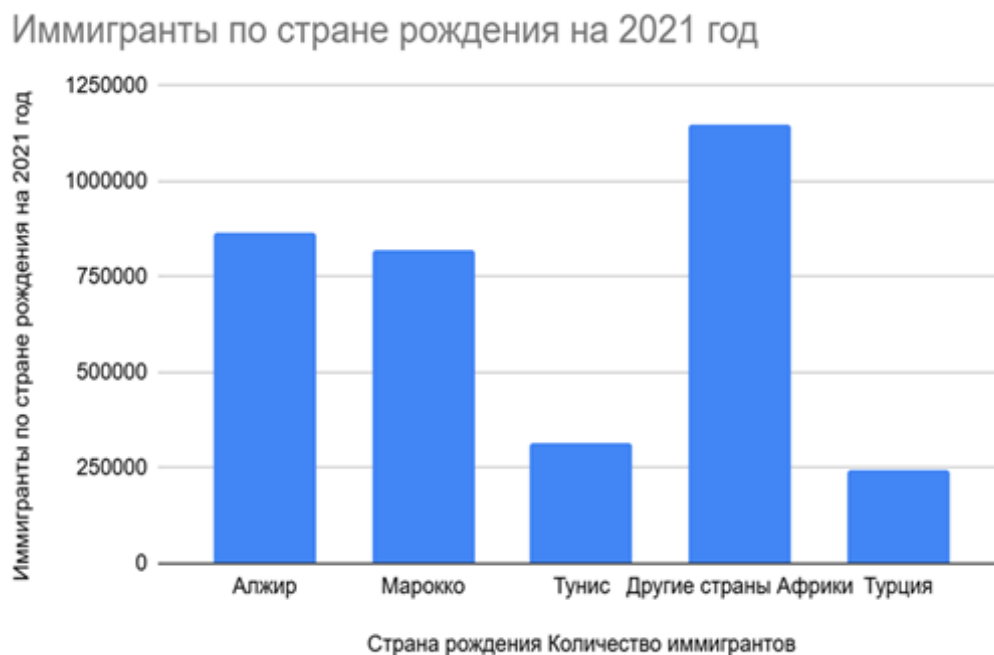
Рис. : Иммигранты по стране рождения на 2021 год