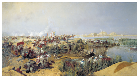
Рис. : Переправа туркестанского отряда через Аму-Дарью