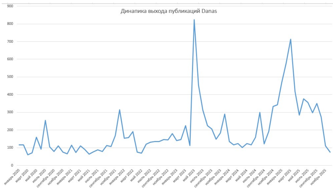
Рис. : Результаты количественного контент-анализа выхода публикаций в СМИ Danas