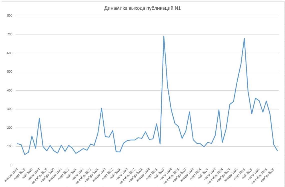
Рис. : Результаты количественного контент-анализа выхода публикаций в СМИ N1