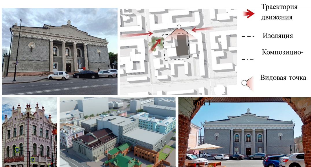
Рис. : Красноярский драматический театр имени А.С. Пушкина