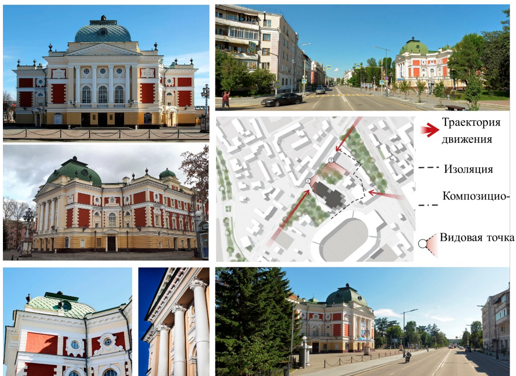
Рис. : Иркутский академический драматический театр им. Н.П. Охлопкова