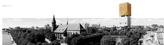
Рис. : Проект [A+M] 2 Architects. Италия