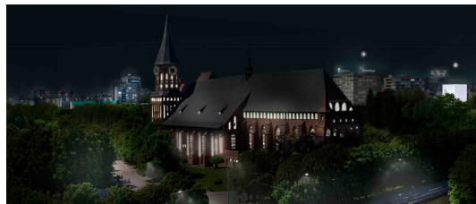
Рис. : Проект Марко Тапия Лопеса и Кармен Фигейрас. Испания