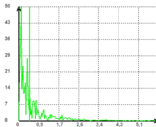
Рис. 3. Пример сагитальной АЧХ стабилометрической записи