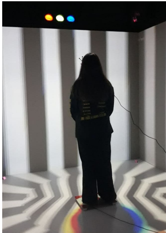
Рис. 1. Проведение исследования в системе виртуальной реальности CAVE