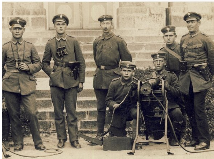
Рис. 1. Германский фрайкор в Либаве, февраль 1919 года