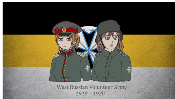
Рис. 3. Современное стилизованное изображение, посвященное русским добровольцам в Курляндии. Хорошо видно германское обмундирование.