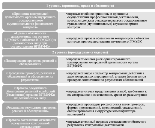
Рис. 2. Рисунок 2. Система федеральных стандартов внутреннего государственного финансового контроля и их основные характеристики