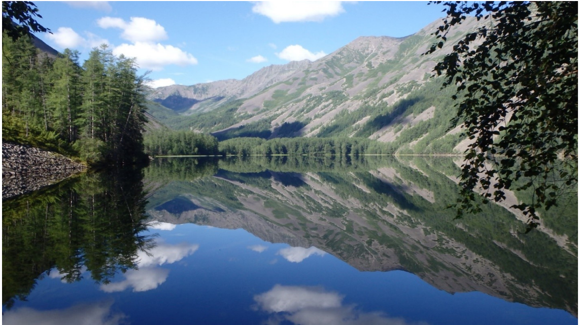
Рис. 1. Озеро Омот (северо-восточная часть озера)