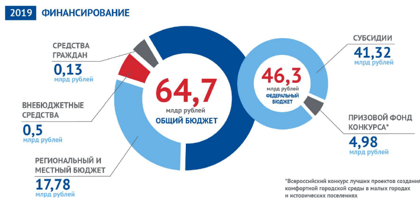
Рис. 1. Рис. 1. Финансирование муниципальных программ по созданию комфортной городской среды в 2019 году [5].