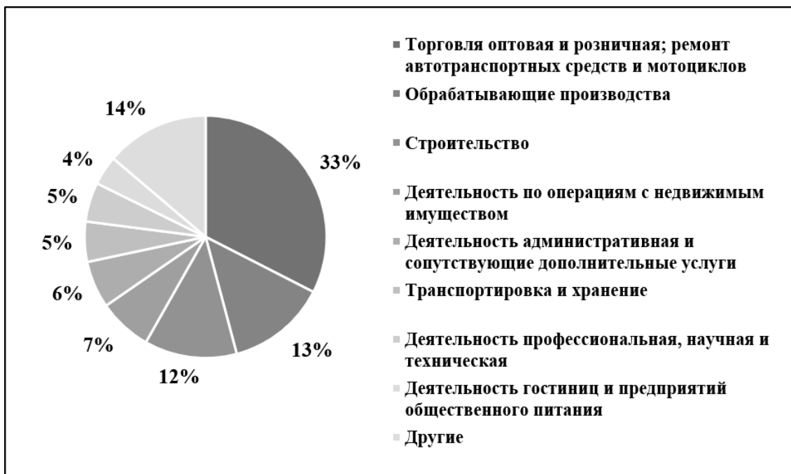
Рис. 2. Отраслевая структура предприятий малого бизнеса России 2018 г., % [5]