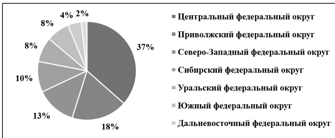
Рис. 1. Географическая структура предприятий малого бизнеса России 2018 г. [5]