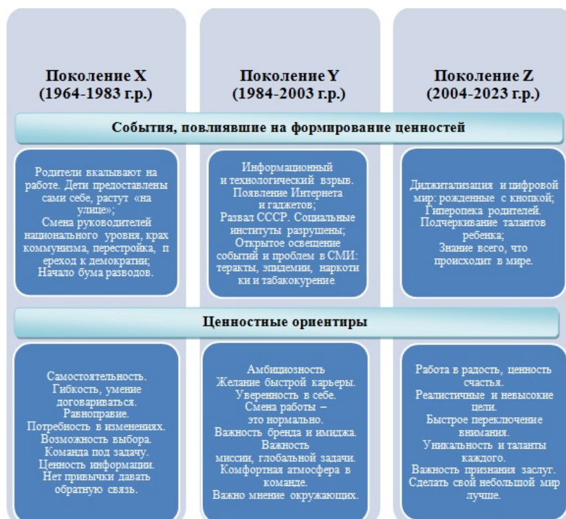
Рис. 2. Сравнительный анализ основных ценностей поколений X, Y, Z