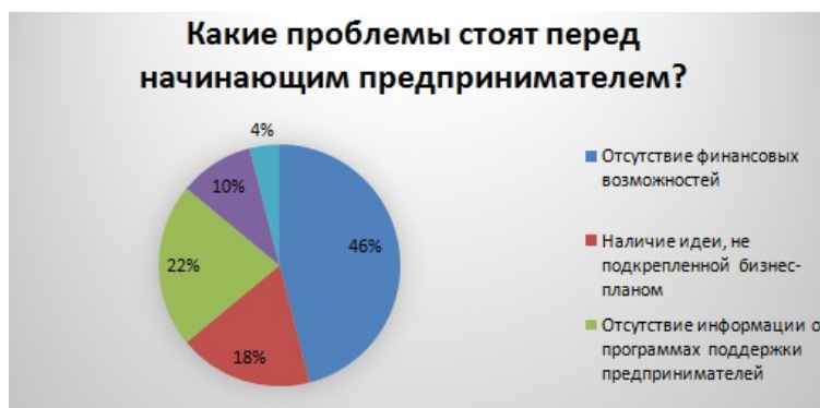
Рис. 5. Ответы на вопрос «Какие проблемы стоят перед начинающим предпринимателем?»