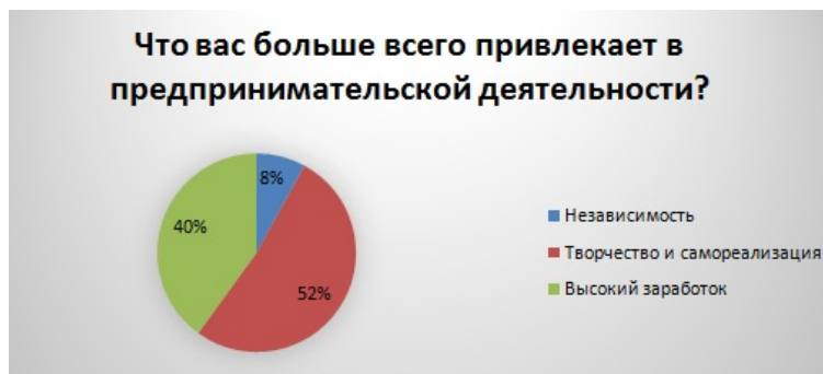
Рис. 6. Ответы на вопрос «Что вас больше всего привлекает в предпринимательской деятельности?»