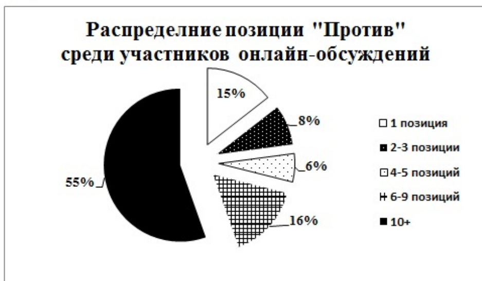
Рис. 2. Распределение позиции "Против" среди участников онлайн-обсуждений