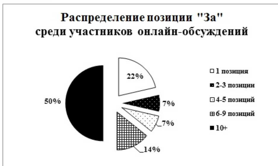
Рис. 1. Распределение позиции "За" среди участников онлайн-обсуждений