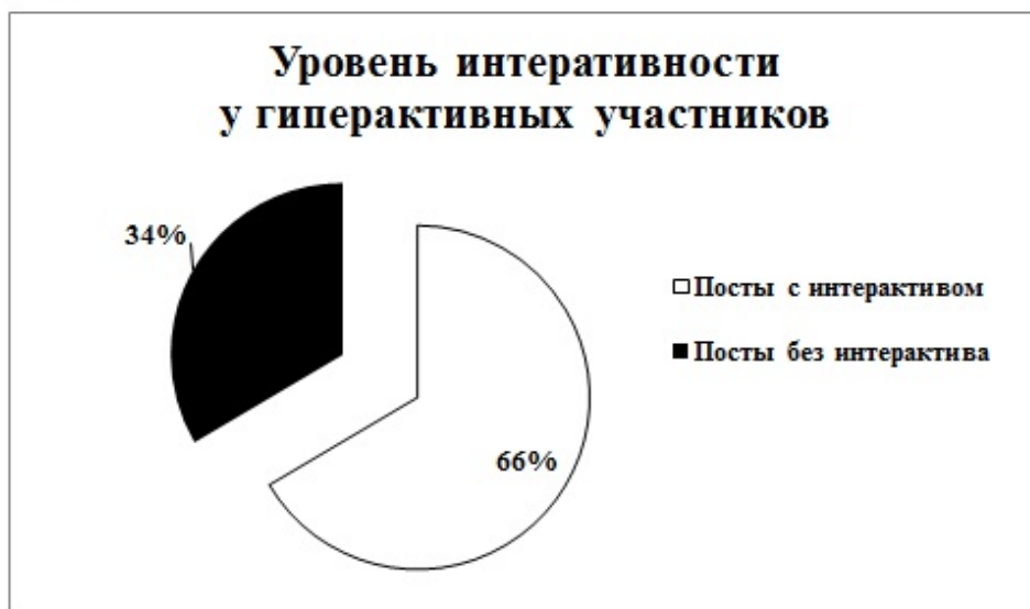
Рис. 3. Уровень интерактивности у гиперактивных участников