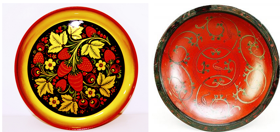
Рис. 2. Лаковые изделия (слева – русское изделие в традиции хохломы, справа – китайское лаковое изделие)