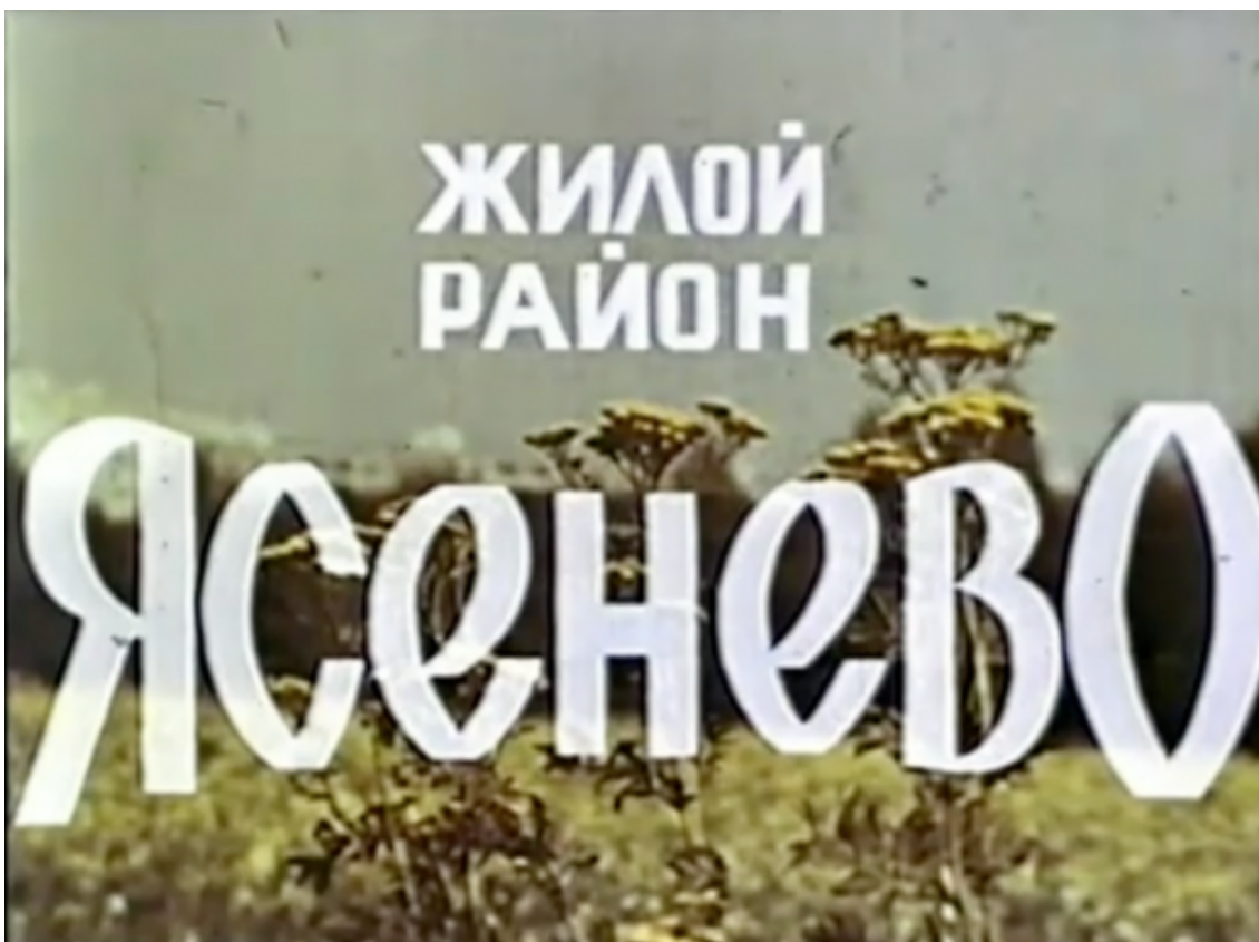
Рис. 9. Anabasis