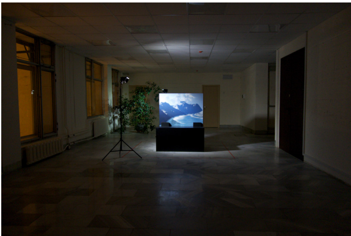
Рис. 1. Anabasis