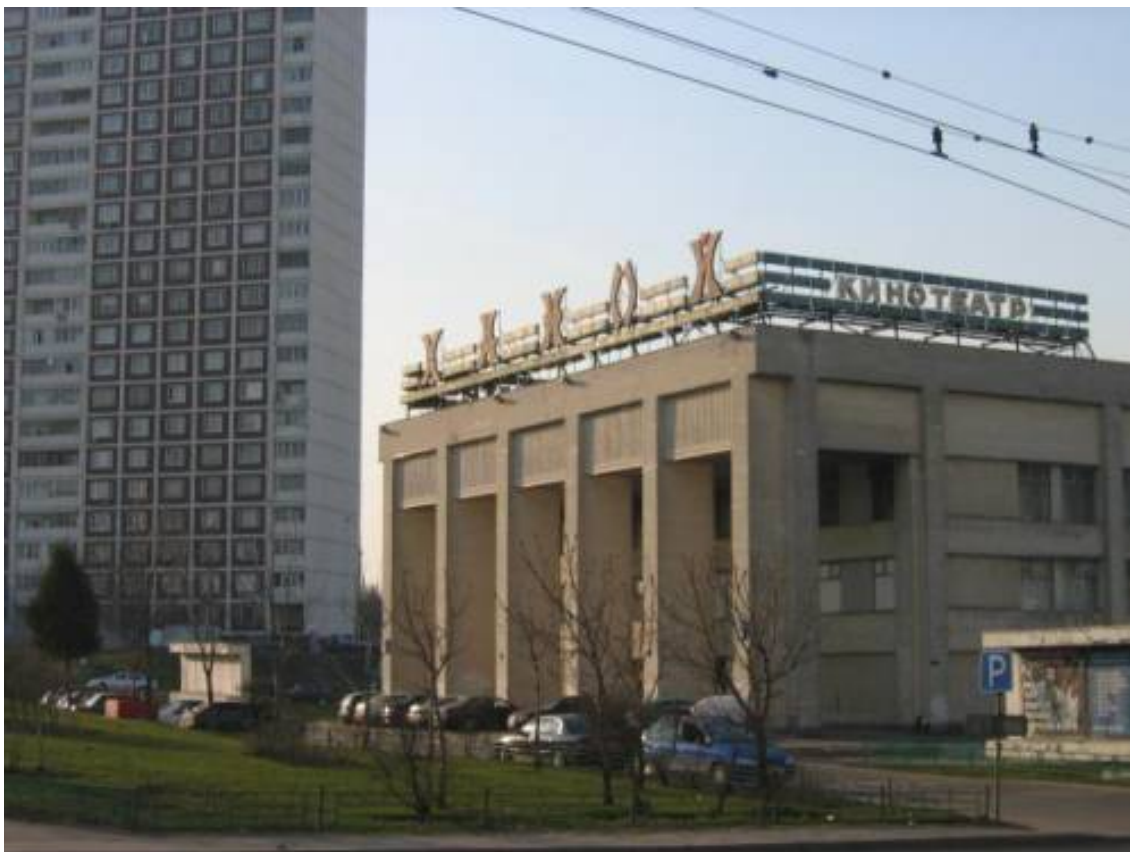
Рис. 2. Anabasis