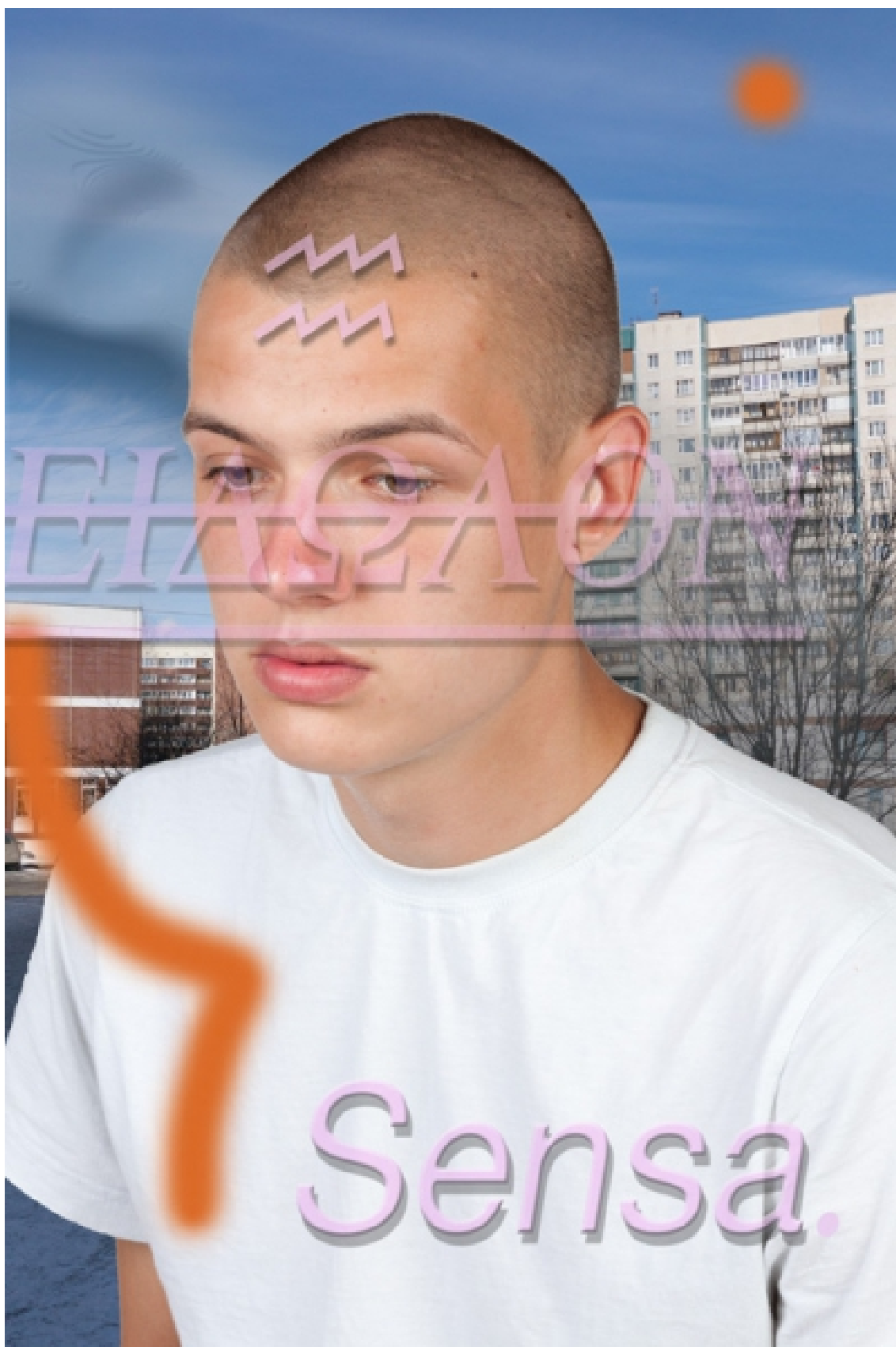
Рис. 7. Anabasis