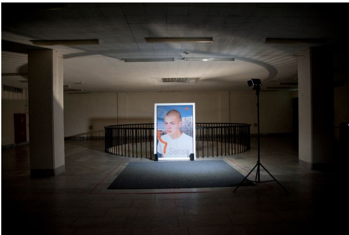
Рис. 5. Anabasis