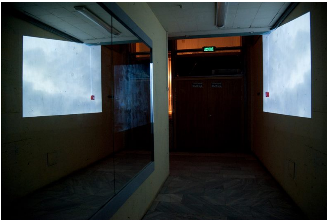
Рис. 4. Anabasis