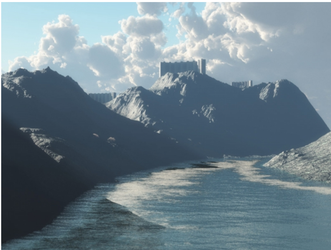
Рис. 8. Anabasis