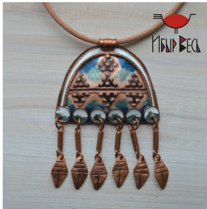
Рис. 7. Подвеска «Арка». Мастерская «Ибыр Вель», н. XXI в.. Материал: медь, эмаль. Размер: 5,5смх7,5см.