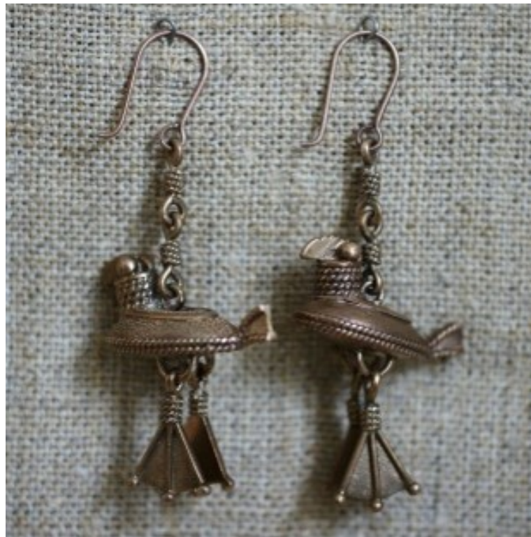
Рис. 5. Серьги «Утица». Зорин П. М., 2014 г.