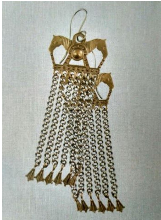
Рис. 3. Серьги «Кони» Зорин П. М., н. XXI в.