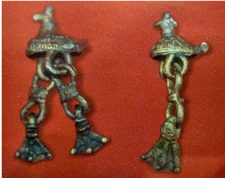
Рис. 4. Шумящие подвески с основой в форме полых фигурок птиц. Бронза, двустороннее литьё. Городище Иднакар (д. Солдырь, Глазовский р-н). X в. Раскопки М. Г. Ивановой, 1999 г. МЗИ, 27/913, 914.