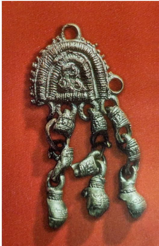
Рис. 6. Шумящая подвеска с арочной основой. Белый сплав, литьё. Городище Иднакар (д. Солдырь, Глазовский р-н). XII в. Раскопки М. Г. Ивановой, 1989 г. МЗИ, 15/92.