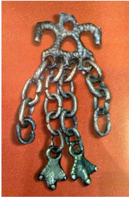
Рис. 2. Шумящие коньковые подвески. Бронза, двустороннее литьё. Городище Иднакар (д. Солдырь, Глазовский р-н). X в. Раскопки М. Г. Ивановой, 1999 г. МЗИ, 27/912.