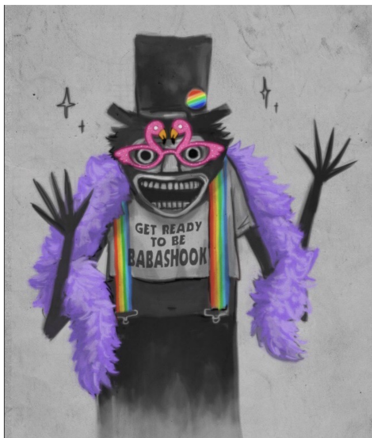
Рис. 2. Фанарт с изображением антагониста фильма «Бабадук»