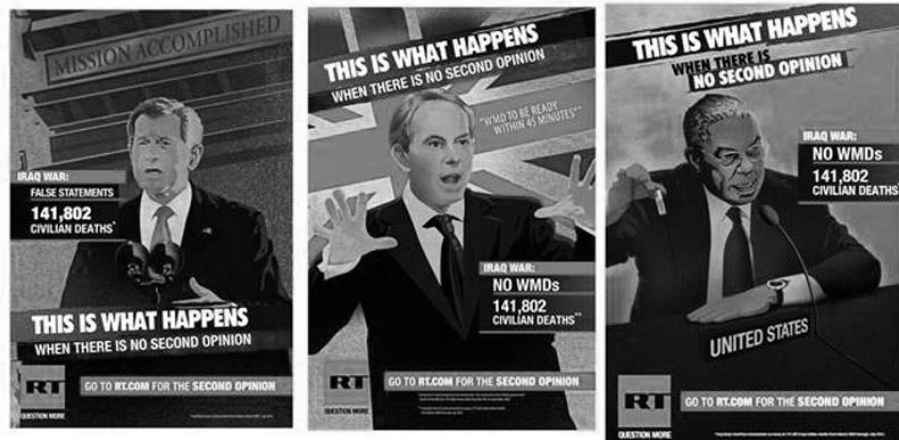
Рис. 3. Рисунок 3