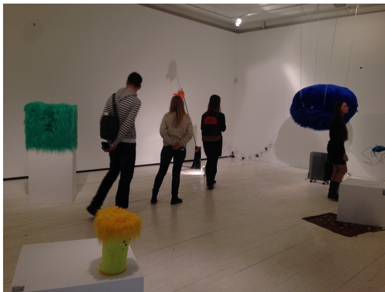
Рис. 1. Выставочный зал ММСИ на Петровке, в котором экспонируется проект "Всё сложно"