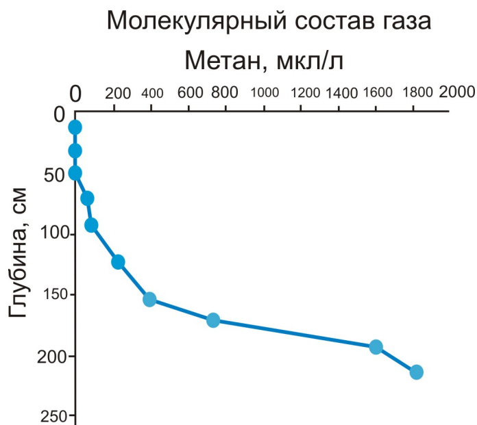
Рис. 2. Распределение концентрации метана с глубиной для станции 084G структуры Красный Яр.