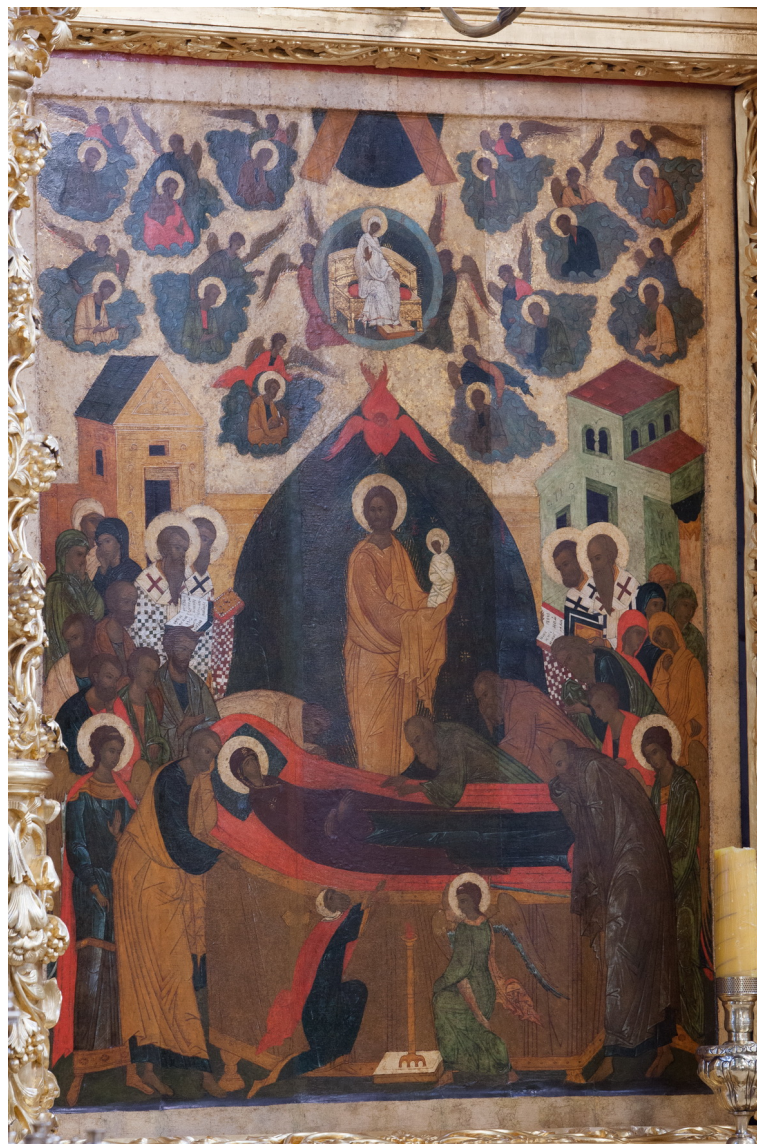
Рис. 2. Храмовая икона