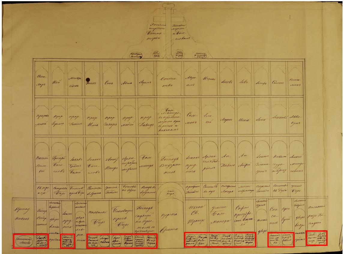
Рис. 3. План иконостаса 1865 г.