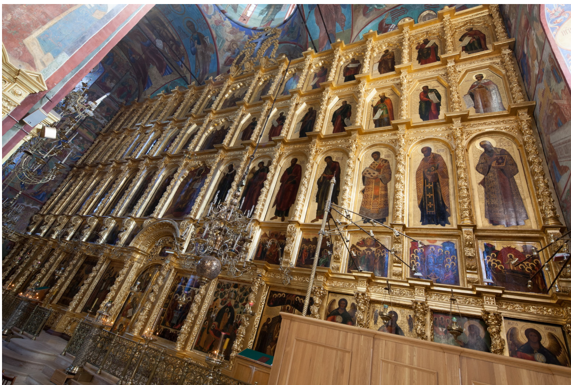
Рис. 1. Общий вид иконостаса