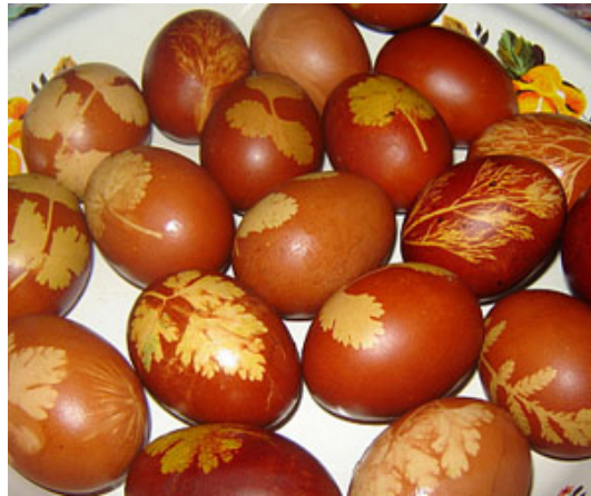
Рис. 1. Крашенные яйца к Дню весны. Дагестан