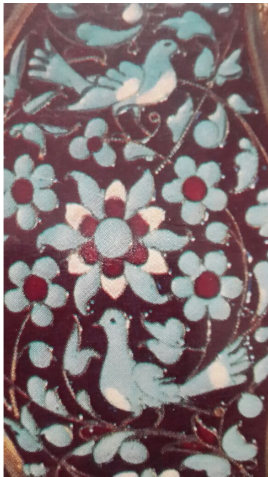
Рис. 4. Образ птицы в ювелирном изделии 20 в