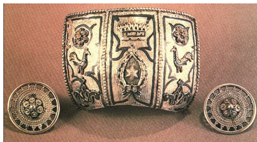
Рис. 2. Женские головные украшения с. Гидаталь. 19-20 в