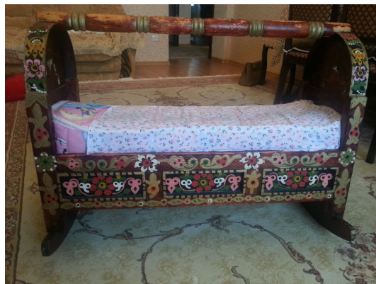
Рис. 3. Наша семейная люлька