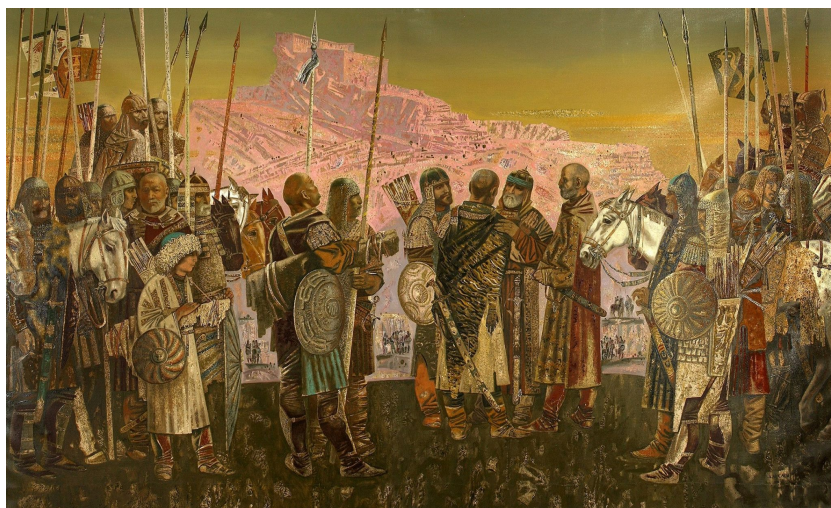
Рис. 4. 4.Мусаев - XVII век. Шамхалы. После междоусобиц. 1997