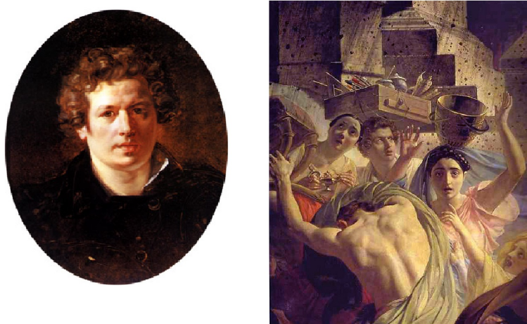
Рис. 3. 3.Брюллов.Автопортрет. Последний день Помпеи - Фрагмент