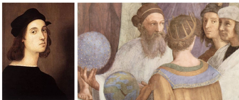
Рис. 1. 1.Рафаэль .Автопортрет, Афинская школа - фрагмент