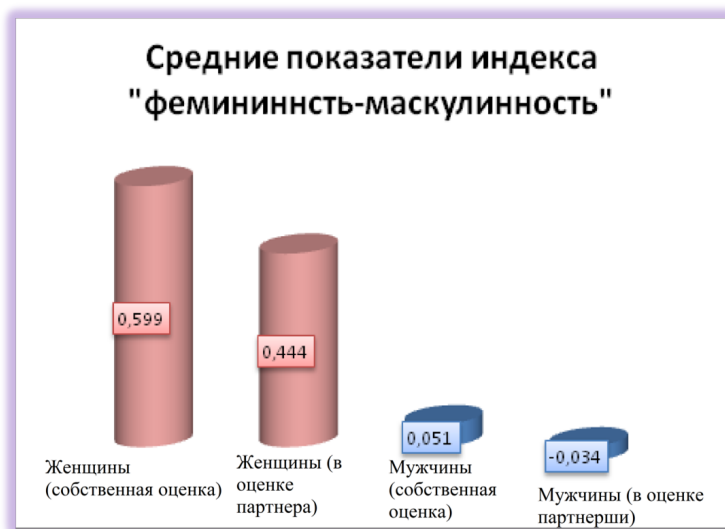
Рис. 1. Средние показатели индекса "фемининность-маскулинность"