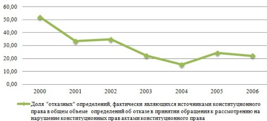
Рис. 1: Доля «отказных» определений, фактически являющихся источниками конституционного права в общем объеме определений об отказе в принятии обращения к рассмотрению на нарушение конституционных прав актами конституционного права