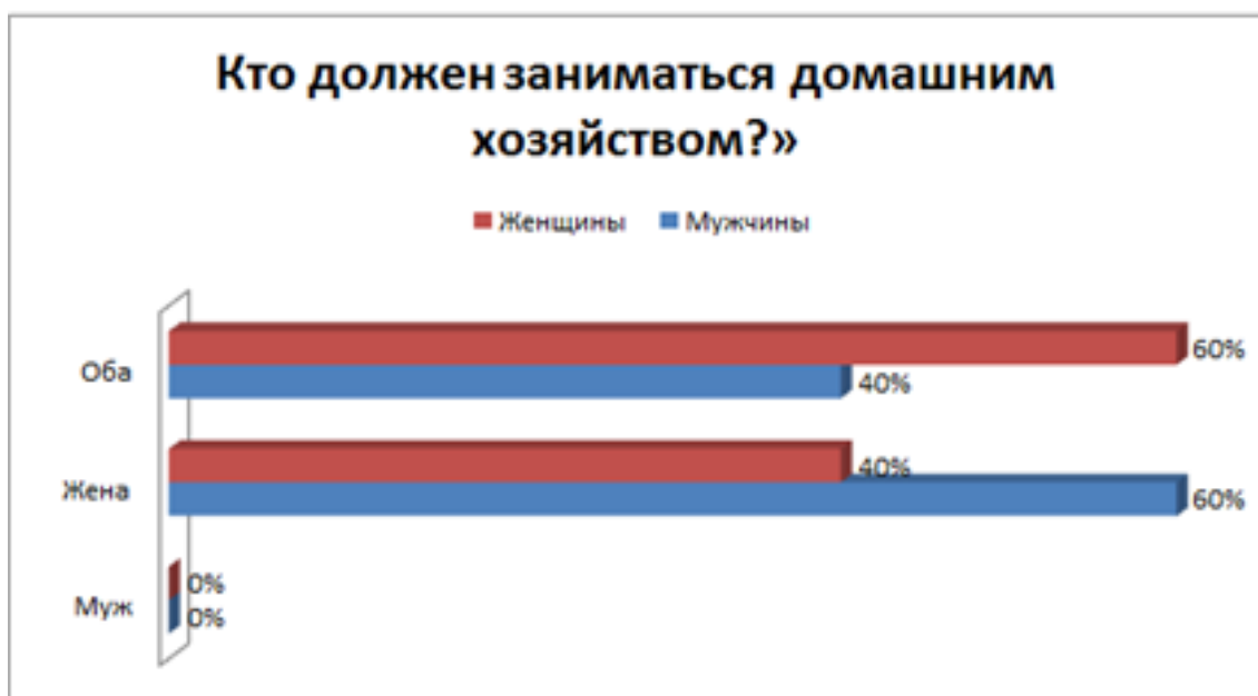
Рис. 2: Рисунок 2. Представления о распределении домашних обязанностей.