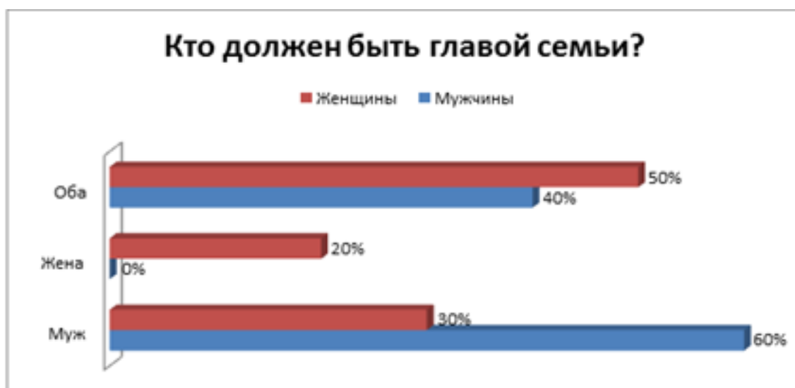
Рис. 1: Рисунок 1. Представления о главенстве в семейной иерархии.