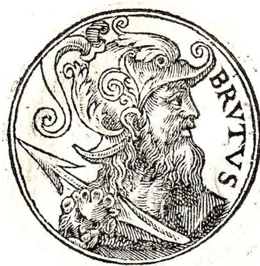
Рис. 4: Брут