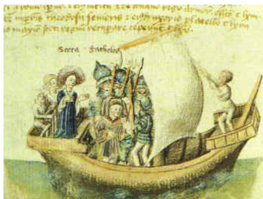
Рис. 5: Гойдел