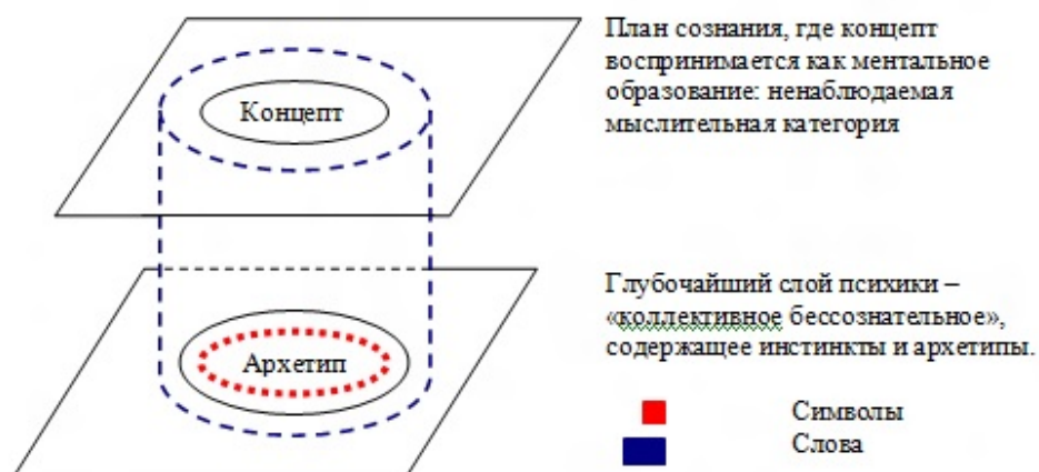
Рис. 1: Визуальное представление гипотетической лингвокультурологической связи архетипа и концепта