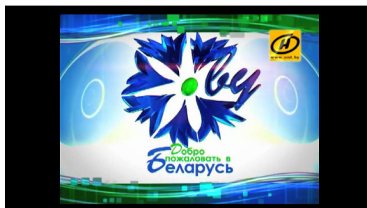
Рис. 1: Заставка к проекту «Добро пожаловать в Беларусь»