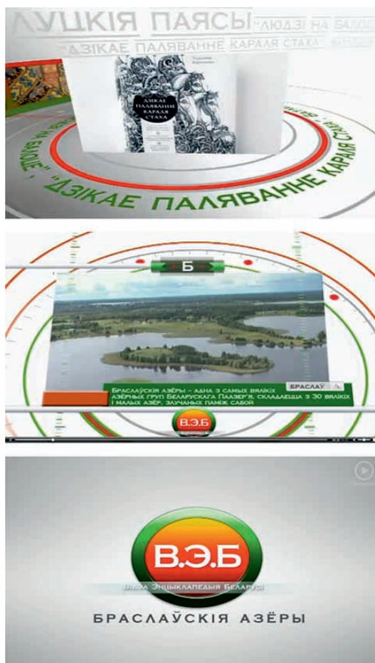
Рис. 4: Заставки к проекту «Видео Энциклопедия Беларуси»