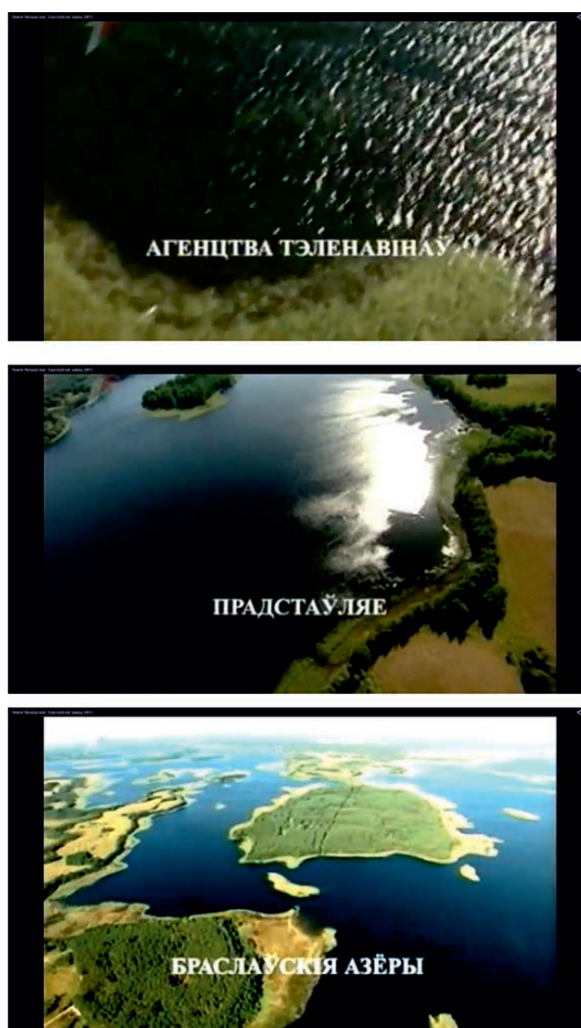
Рис. 2: Оформление вспомогательного текста (проект «Зямля беларуская»)