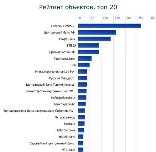
Рис. 3: Рисунок 2