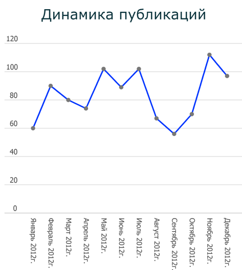
Рис. 1: Рисунок 1