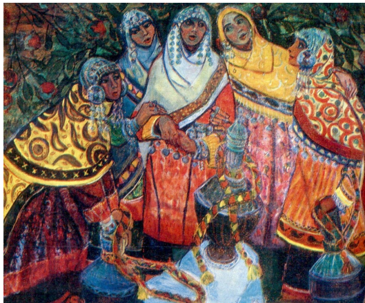
Рис. 2: Конопацкая.-Песня.1973