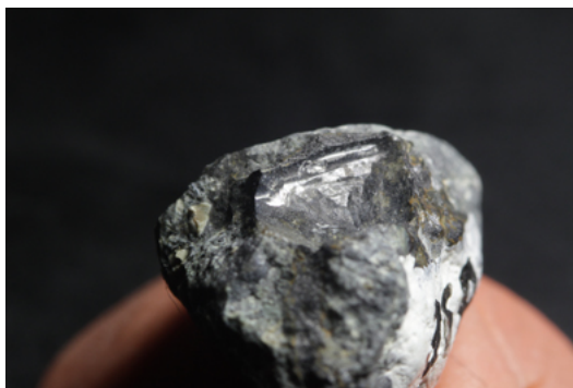
Рис. 1: Общий вид магнетитового отпечатка алмаза