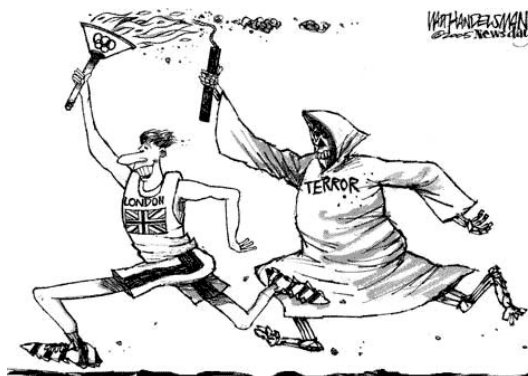
Рис. 5: одна из карикатур, посвященных терактам в Лондоне 2005 года