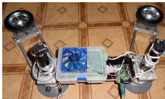
Рис. 2: Фотография прототипа