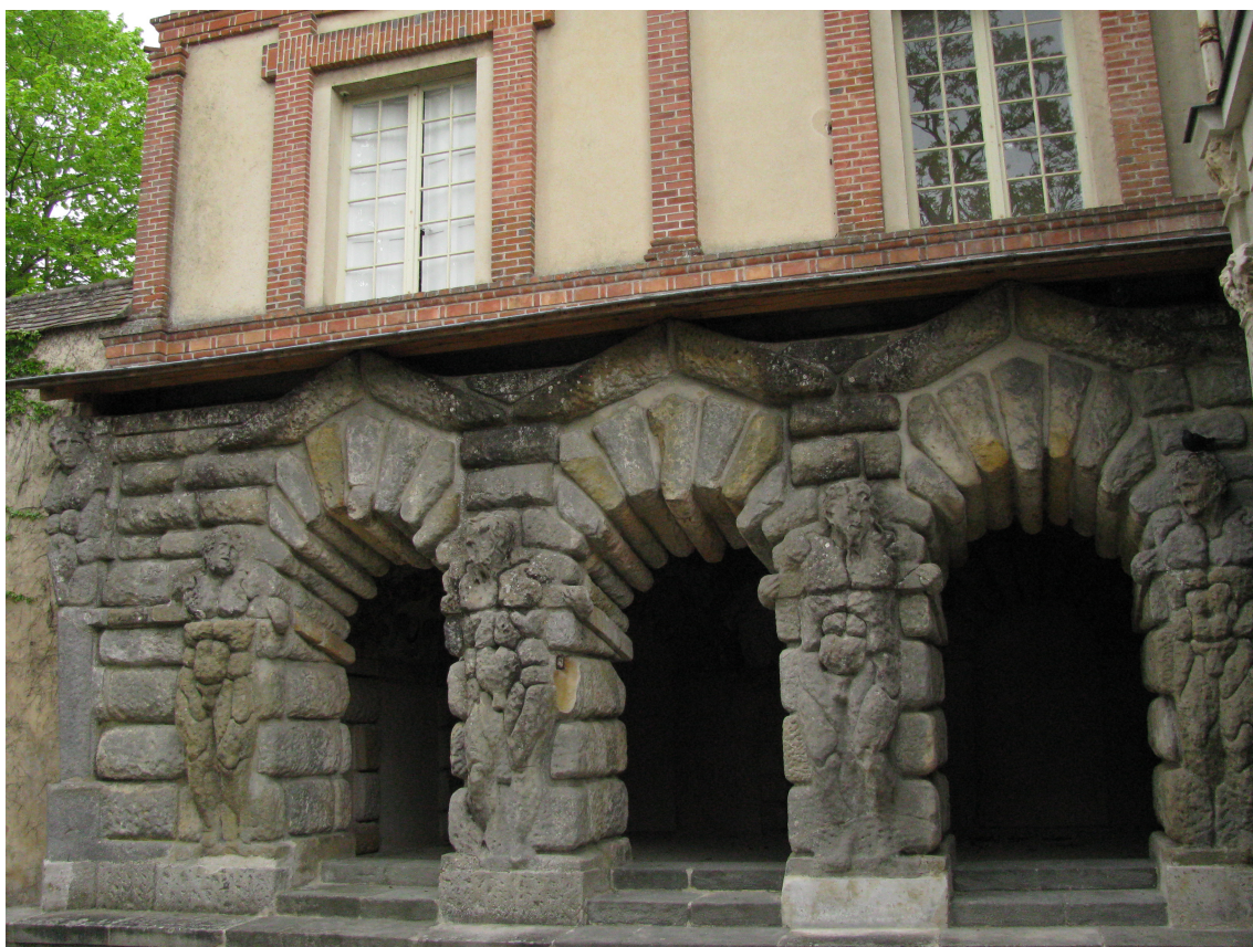
Рис. 1: Грот Сосен в Фонтенбло, Ф. Приматиччо, ок. 1543 г.