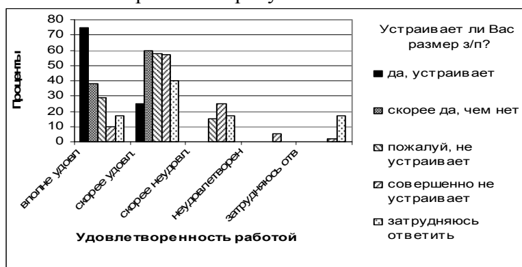
Рисунок 1 - Зависимость состояния удовлетворенности трудом от удовлетворенности заработной платой

Исследование, проведенное среди преподавателей Орловского государственного технического университета, выявило ряд недостатков в существующей системе стимулирования труда ППС. Так, например, большинство преподавателей неудовлетворены материальной составляющей стимулирования: 43% опрошенных указали на полную неудовлетворенность своими заработками, 28% преподавателей скорее не устраивает их заработная плата, и только 4% респондентов удовлетворены доходами от преподавательской деятельности в ОрелГТУ. Это может негативно сказаться на состоянии удовлетворенности трудом, а, следовательно, и на результатах труда. Зависимость между удовлетворенностью трудом и удовлетворенностью заработной платой отражена на рисунке 1.